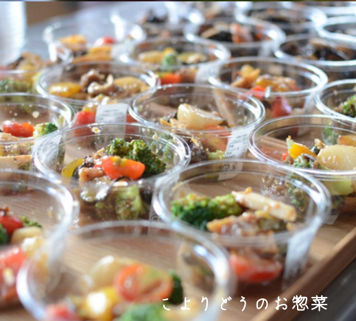
こよりどうのお惣菜